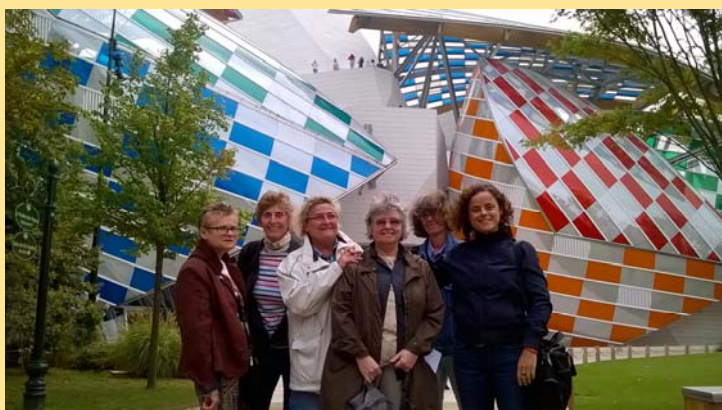
Sortie journées du Patrimoine 2016 à la fondation Louis Vuitton.

Vous êtes curieuse ou intéressée ? refsenioritas@centrelgbtparis.org .